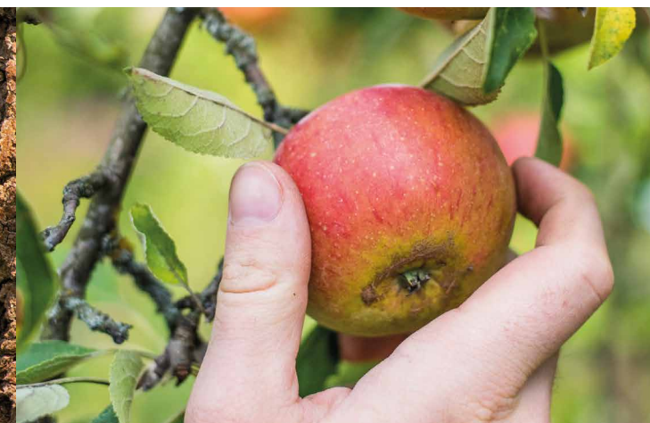
Echte Handarbeit ist bei der Ernte gefragt