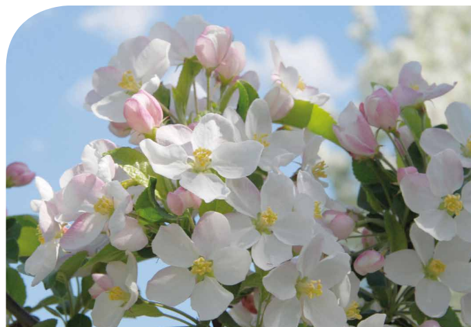
Blühende Streuobstbäume sind für Bienen und andere Insekten das Paradies