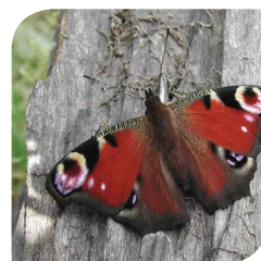
Ein Tagpfauenauge und die Birne „Gräfin von Paris“

Auf einer Streuobstwiese stehen hochstämmige Obstbäume, deren große Kronen bei etwa 1,80 Meter ansetzen. Noch bis Mitte des letzten Jahrhunderts leisteten Streuobstwiesen einen wichtigen Beitrag zur Obstversorgung, oft waren sie fester Bestandteil von landwirtschaftlichen Betrieben. Doch im Zuge des Obstanbaus in Niederstamm-Plantagen wurden sie wirtschaftlich uninteressant und die Bestände gingen stark zurück.