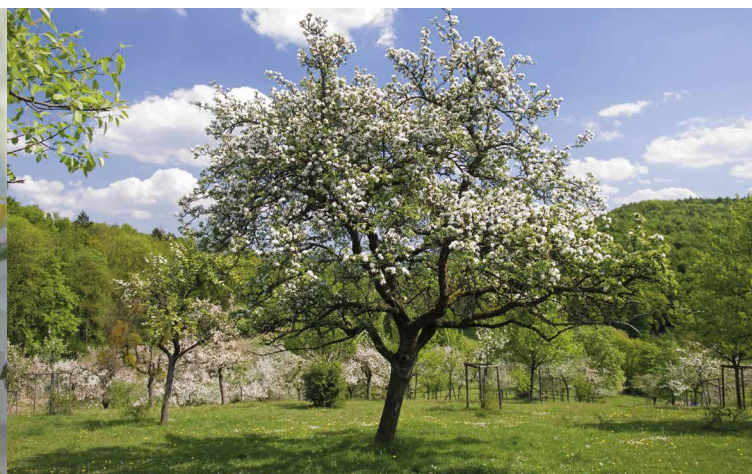
Junge und alte Obstbäume auf einer ostwestfälischen Streuobstwiese