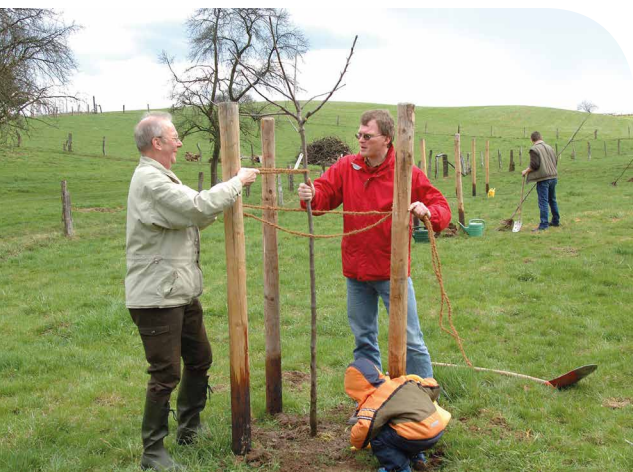
Schon die Kleinsten helfen auf der Streuobstwiese tatkräftig mit