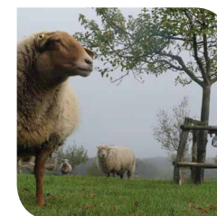
Schafe halten das Gras kurz, wovon der Wendehals bei der Nahrungssuche profitiert

Die Kombination aus Ober- und Unternutzung macht Streuobstwiesen zu einem außergewöhnlichen Ökosystem. Während in der oberen „Etage“ das Obst wächst, wird der Bereich darunter meist als Wiese oder Weide genutzt. Auf einer Streuobstwiese wachsen robuste Sorten, chemisch-synthetische Dünge- und Pflanzenschutzmittel sind nicht erforderlich – all das macht Streuobstwiesen zu einem einzigartigen Lebensraum: Über 5.000 Tier- und Pflanzenarten sind auf den Streuobstwiesen in Deutschland zu finden.