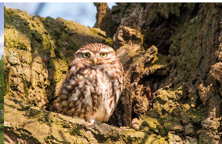
Der Steinkauz nistet gern in den Höhlen hochstämmiger Obstbäume